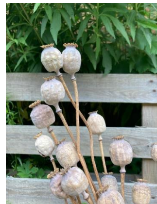
Zaaddozen van Papaver